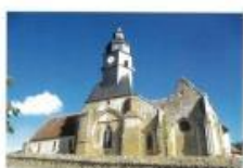
Photo de la paroisse de Moutiers-au-Perche